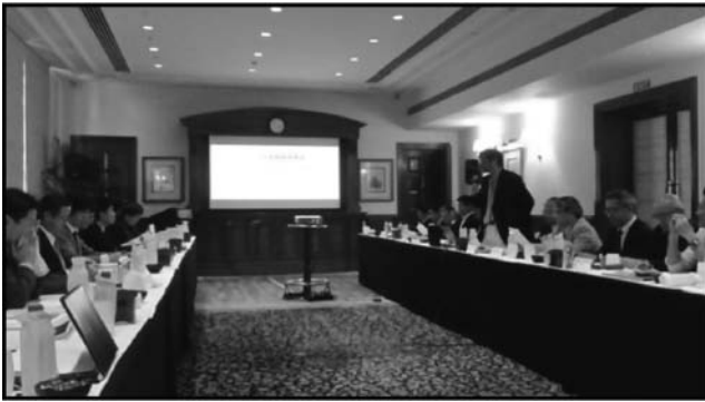
図7：インド IPG の様子

なお、日本において海外での知財権侵害問題の解決をめざす日系企業・団体の集まりとして、ジェトロ東京本部の知的財産課が事務局を務める国際知的財産保護フォーラム（IIPPF）があります。ジェトロニューデリーは、かかる知的財産課と連携し、インド側のインド IPG と日本側の IIPPF との協働を図っています。