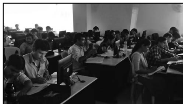
図5（上）：「インド税関における知財保護セミナー」の会場内の様子