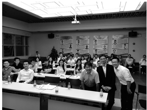
図4 中国で開催された知財セミナーの様子

弁理士会として海外でのセミナー開催などの企画や外国出願への対応に関するご支援をいただけるとありがたいです。