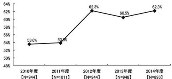
図 4.2-1 インターネットによる模倣被害の状況 推移 （特許庁，「2015 年度模倣被害調査報告書」（2016 年）より引用）

なお、EC サイトにおける模倣品被害については、国境をまたぐ形で行われることも多く、捜査管轄の問題等から、行政機関や公安当局が、模倣品被害に対する摘発に対して積極的ではない、との報告もある。このため、EC サイトにおける模倣品被害に対しては、上述のとおり、EC サイトのプラットフォームを利用した対策を行うことが重要であると考えられる。